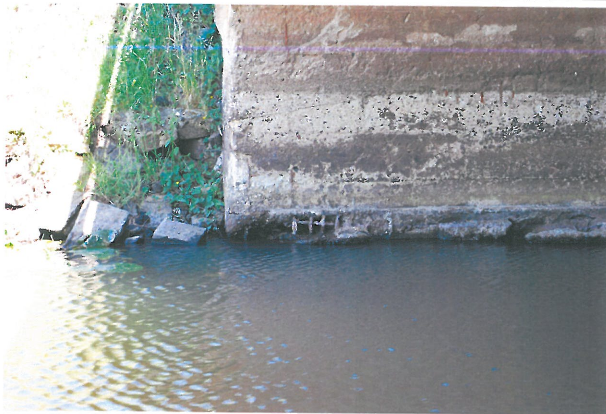
Fot. 19. Ubytki betonu, korozja betonu, korozja odsłoniętych prętów zbrojeniowych przyczółka od strony północnej.