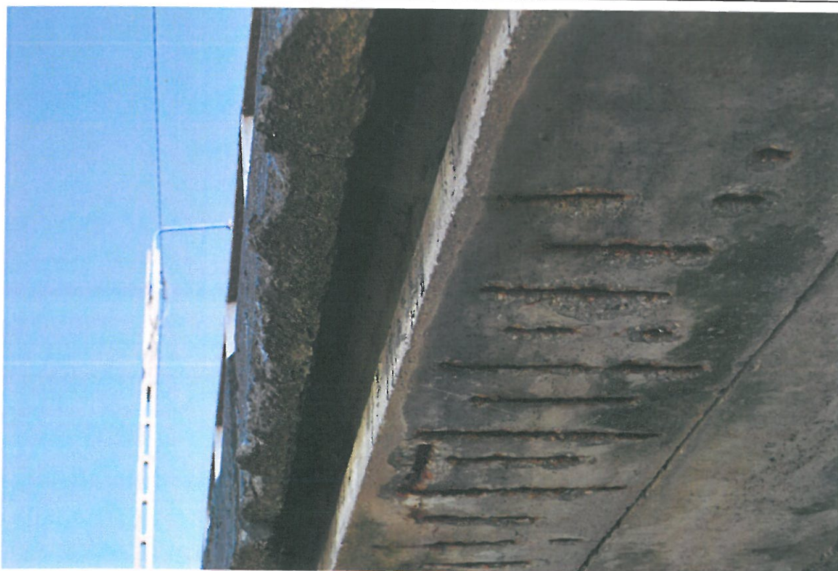
Fot. 18. Ubytki betonu, korozja betonu, korozja odsłoniętych prętów zbrojeniowych belki prefabrykowanej.