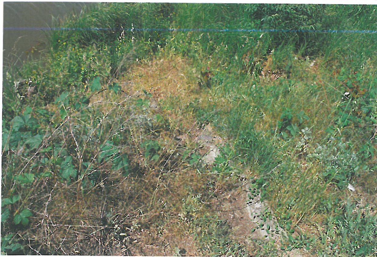
Fot. 17. Wegetacja roślin, zanieczyszczenia, deformacja i ubytki ścieku skarpowego - widok od strony północnej i dolnej wody.