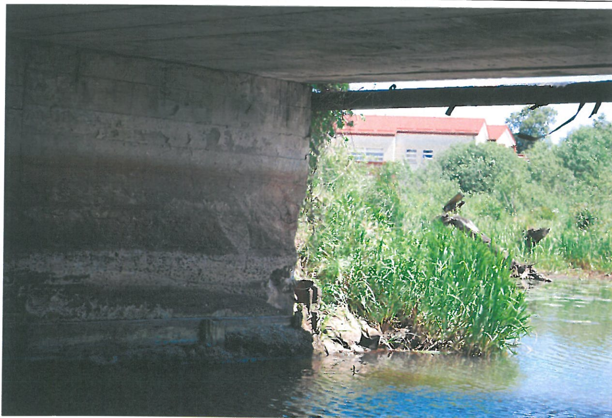
Fot. 20. Ubytki betonu oraz zanieczyszczenia przyczółka od strony północnej.