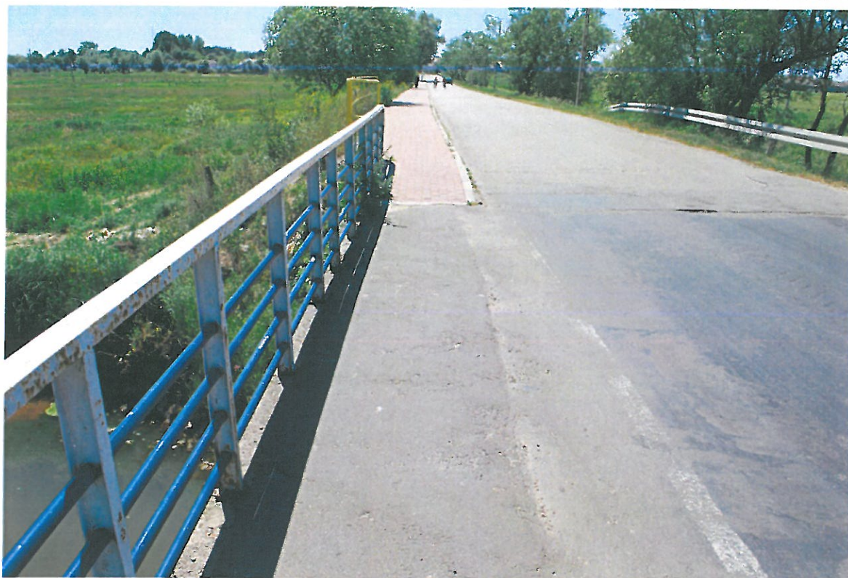
Fot. 9. Deformacje nawierzchni jezdni i chodnika na moście.