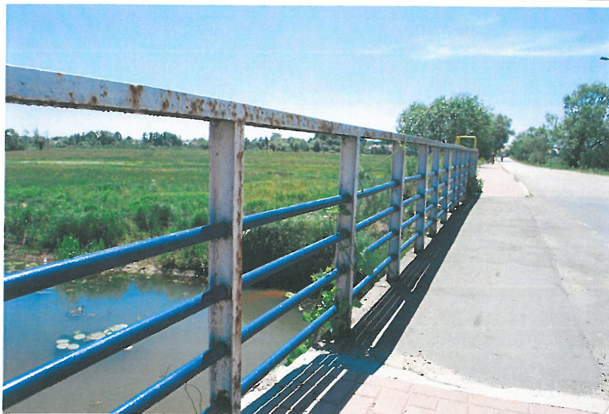
Fot. 10. Korozja balustrady spowodowana brakiem systematycznych prac utrzymaniowych.