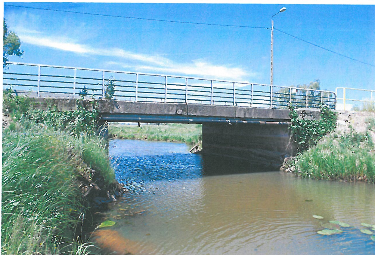
Fot. 3. Widok od strony górnej wody