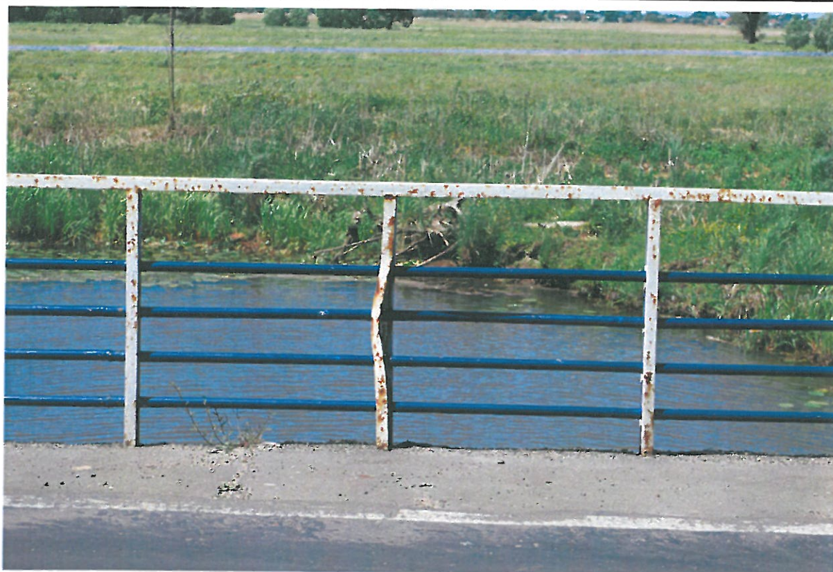
Fot. 11. Korozja i deformacja słupka balustrady.