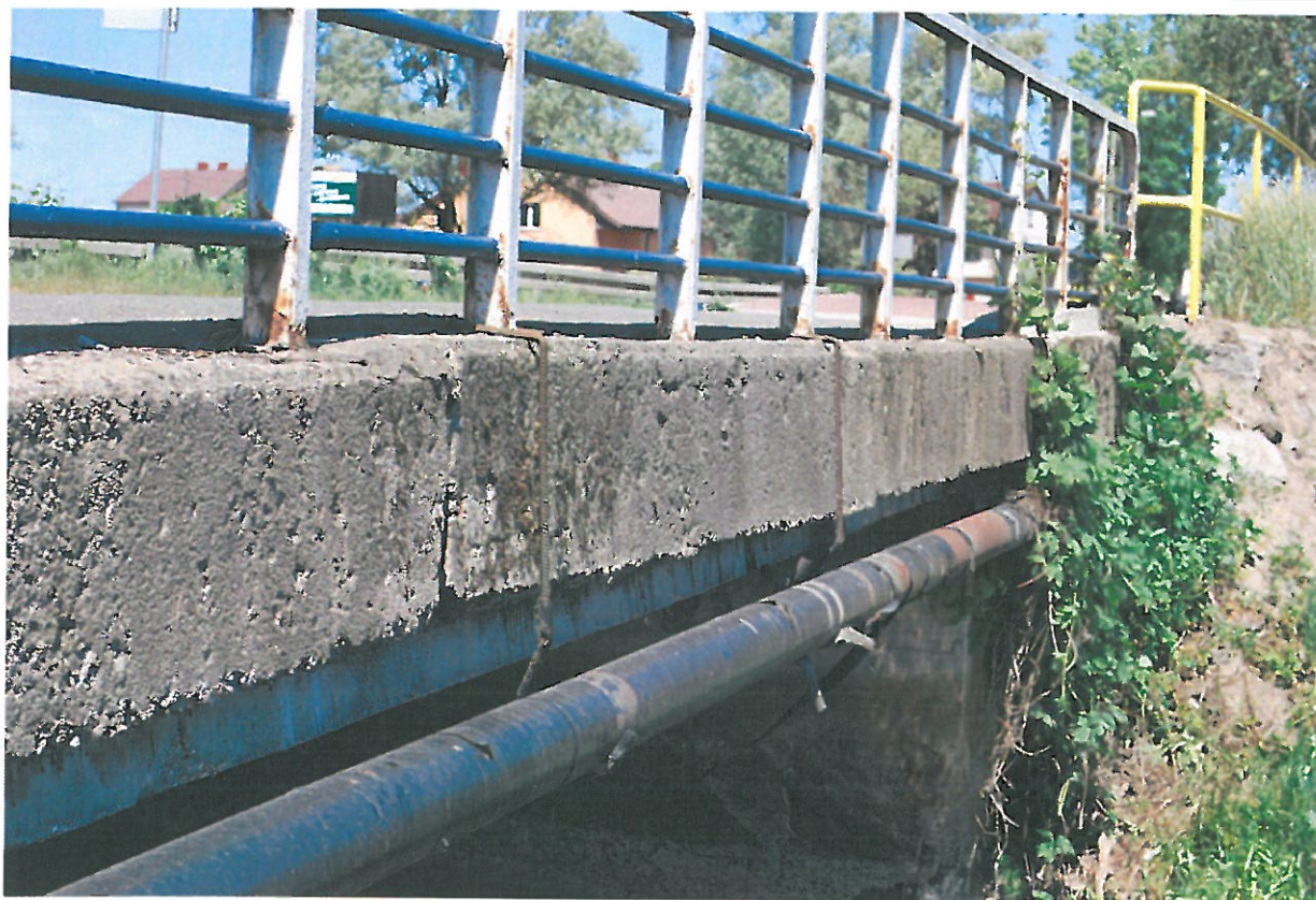
Fot. 22. Zniszczenie zabezpieczeń antykorozyjnych i korozja urządzeń obcych – widok od strony górnej wody.