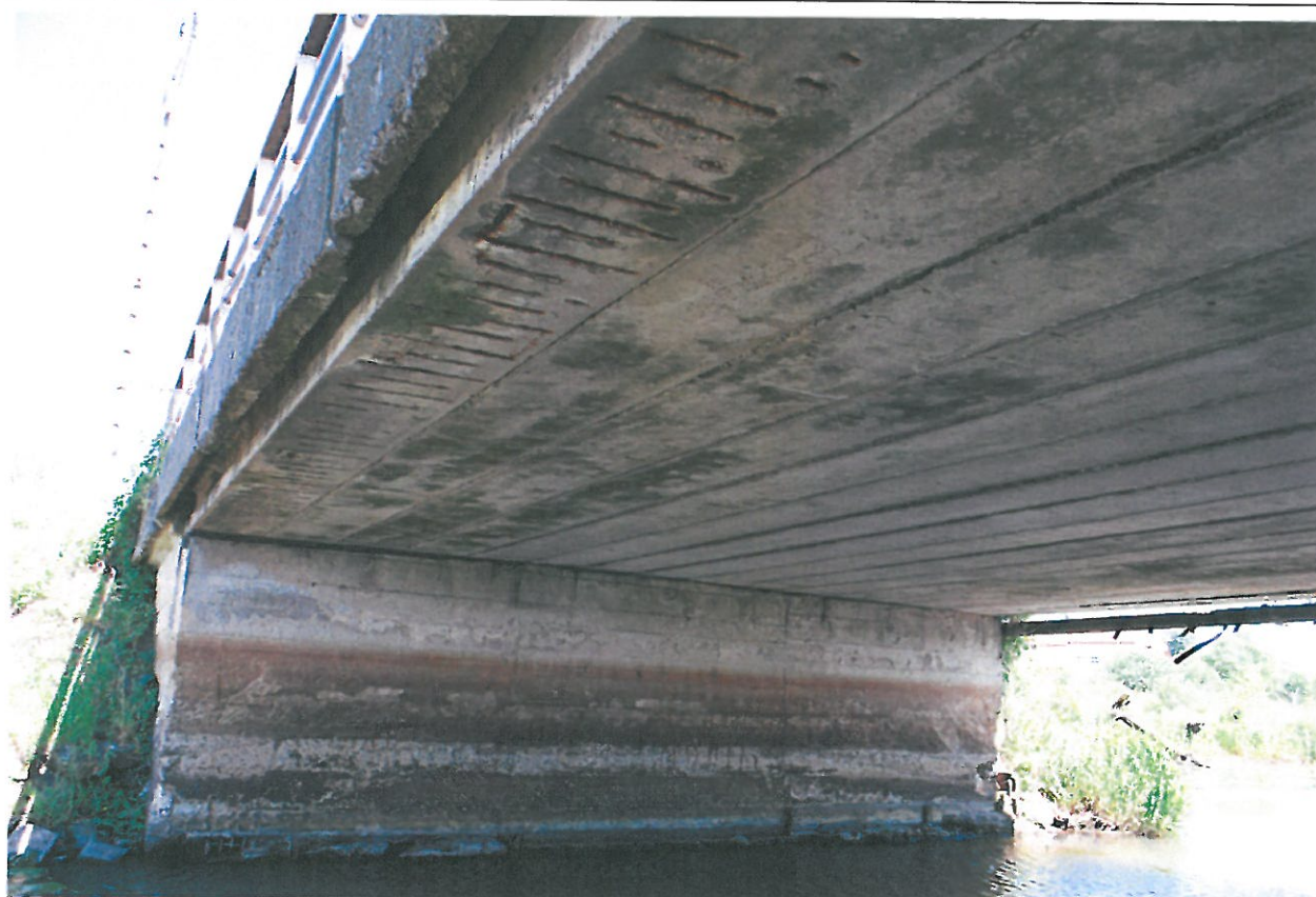
Fot. 4. Widok od spodu