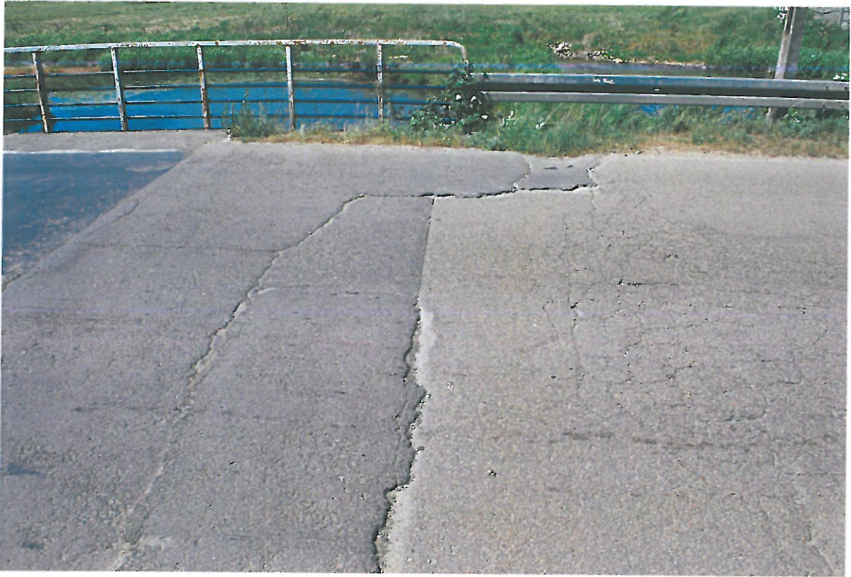
Fot. 7. Rysy, ubytki, deformacje nawierzchni jezdni na dojeździe od strony północnej.