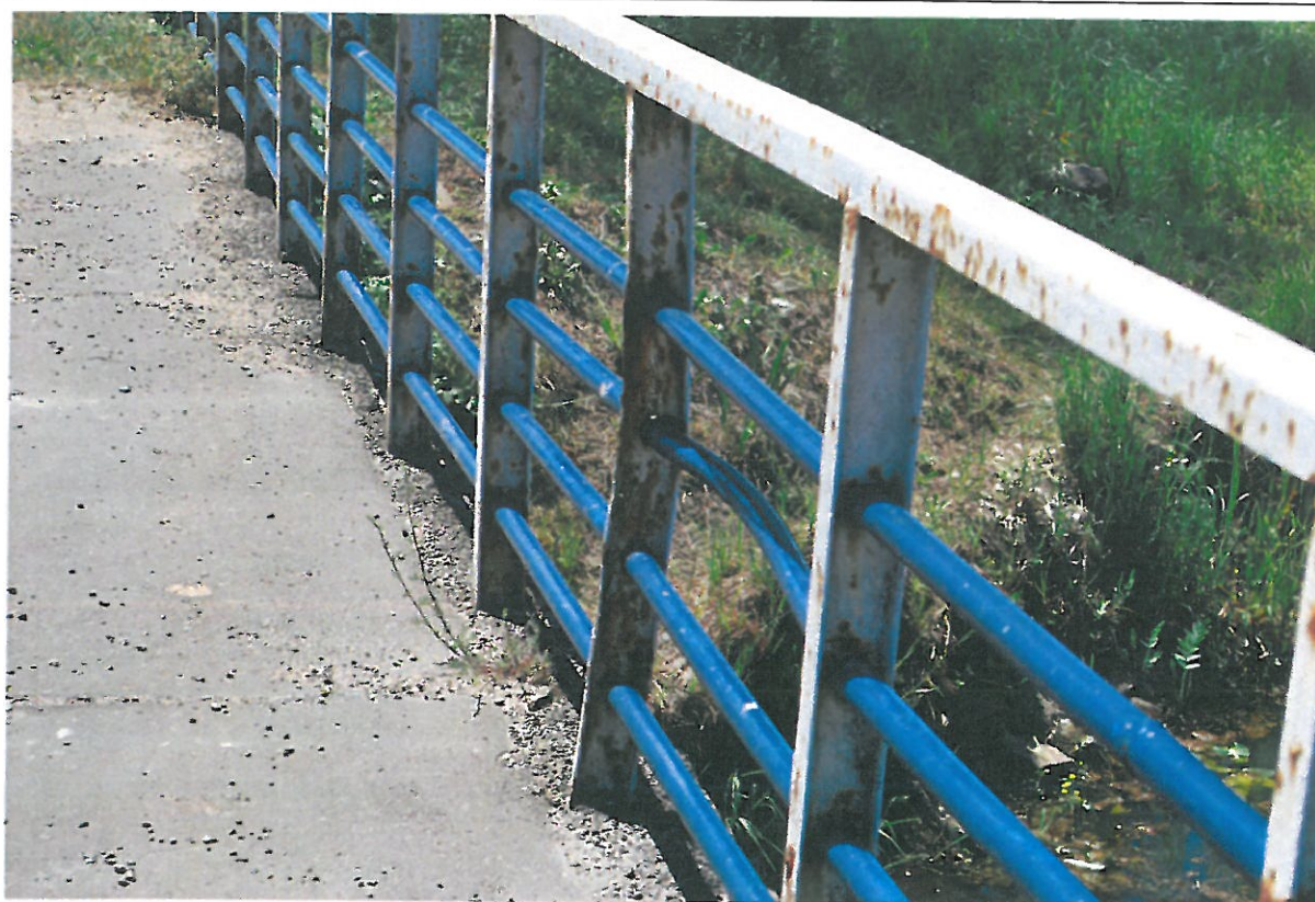
Fot. 12. Korozja i deformacja przeciągu balustrady.