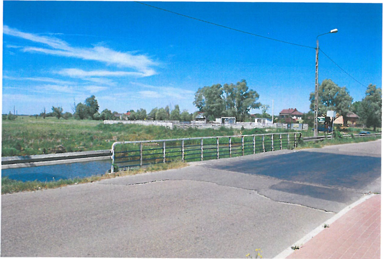
Fot. 1. Widok od strony południowej