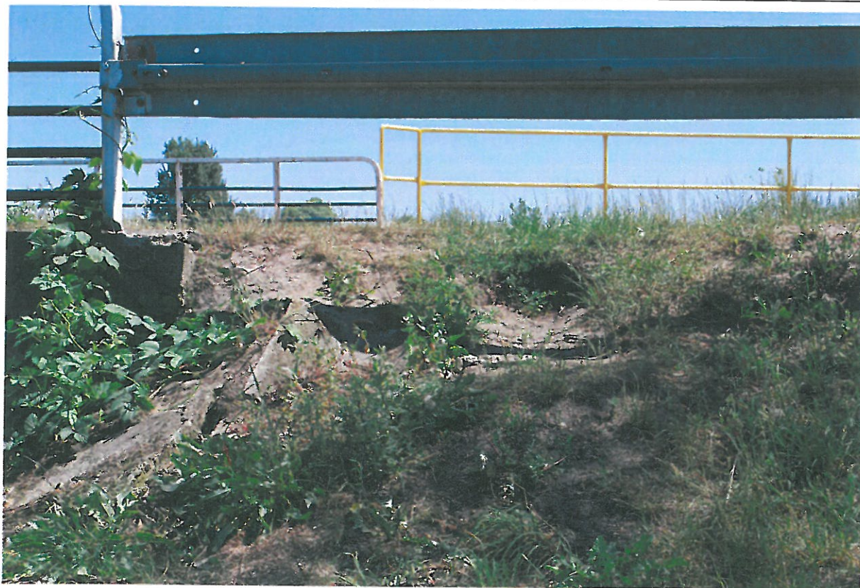
Fot. 16. Wegetacja roślin, zanieczyszczenia, deformacja i ubytki ścieku skarpowego - widok od strony południowej i dolnej wody.