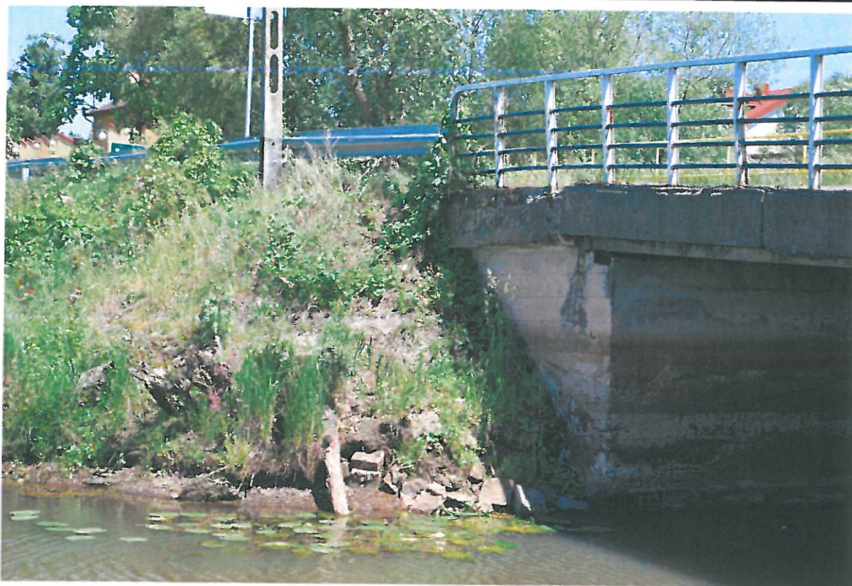
Fot. 15. Przemieszczenie gzymsu skrzydełka od strony północnej – widok od strony dolnej wody