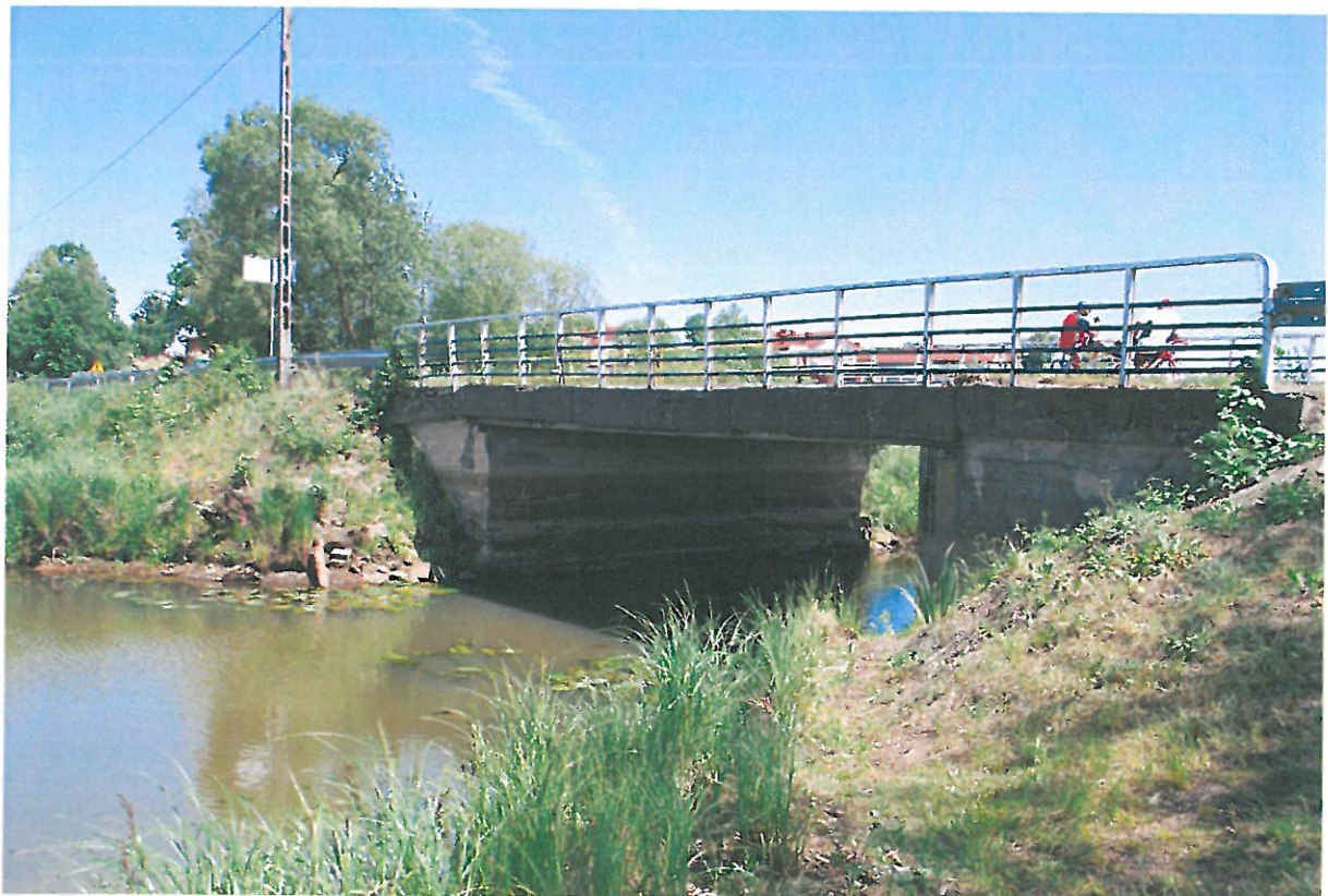
Fot. 2. Widok z boku od strony dolnej wody