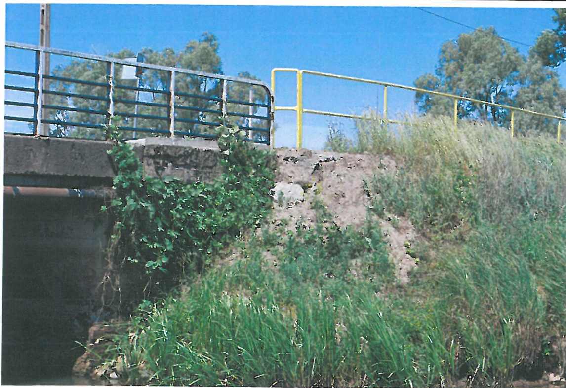
Fot. 6. Wegetacja roślin, ubytki i przemieszczenia gruntu (stożek od strony północnej – widok od strony górnej wody)