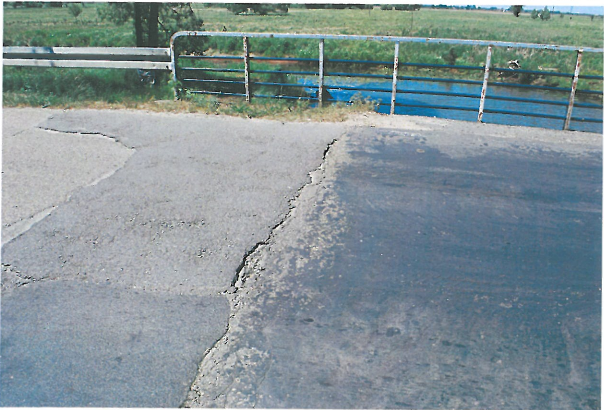
Fot. 8. Rysy, ubytki, deformacje nawierzchni jezdni na dojeździe od strony południowej.