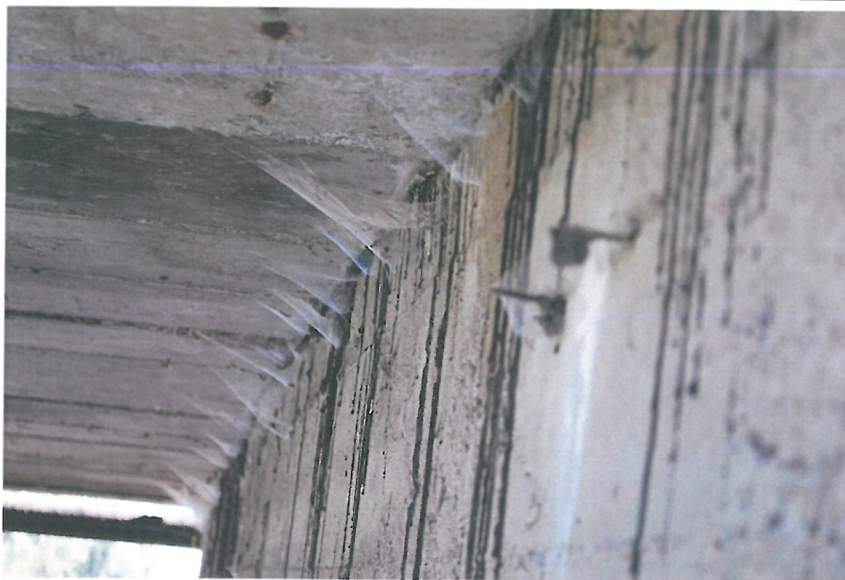
Fot. 21. Zanieczyszczenia przyczółka od strony południowej.