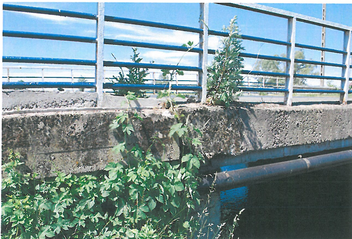
Fot. 14. Wegetacja roślin, zanieczyszczenia i ubytki betonu gzymsu – widok od strony górnej wody.