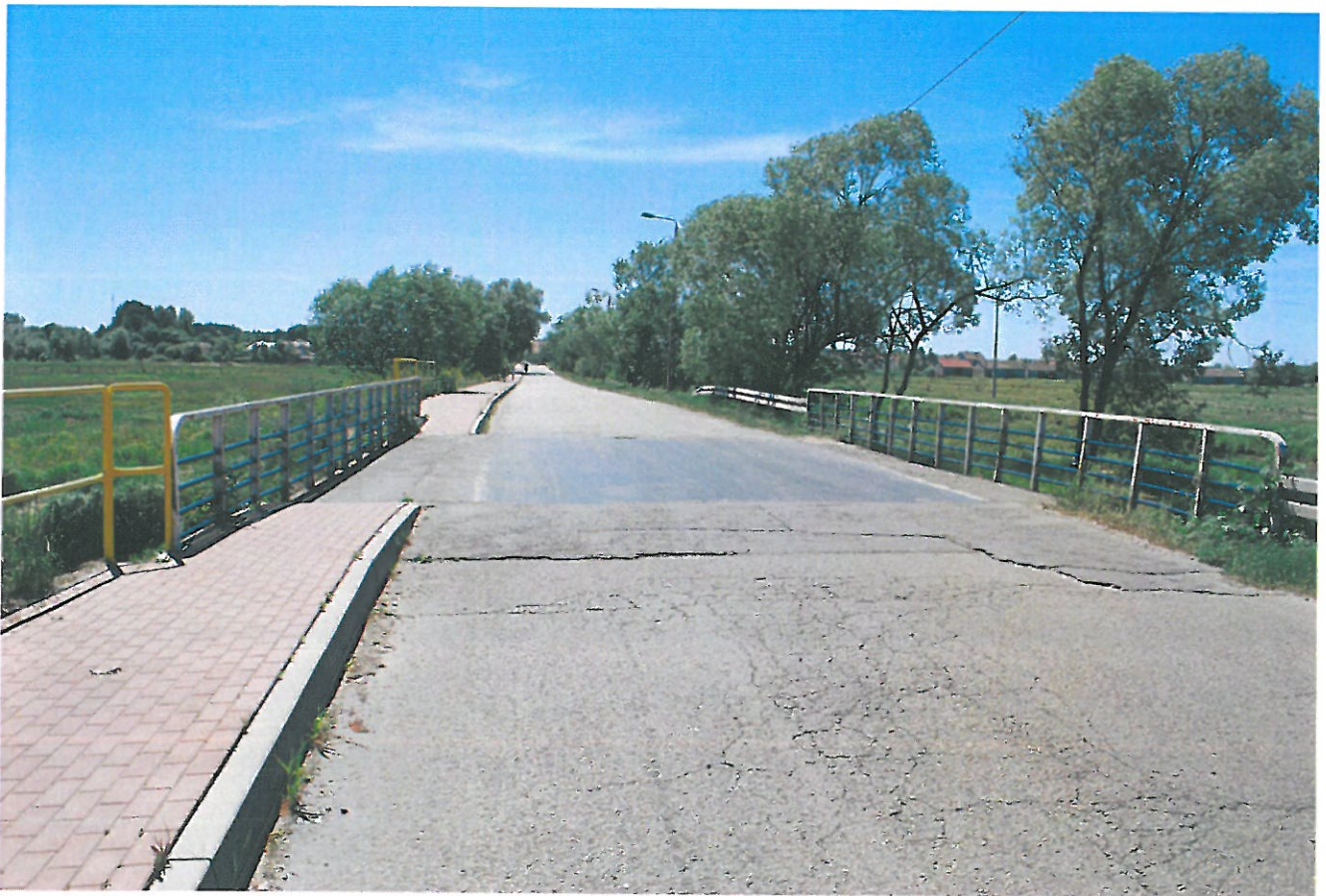
Widok ogólny mostu