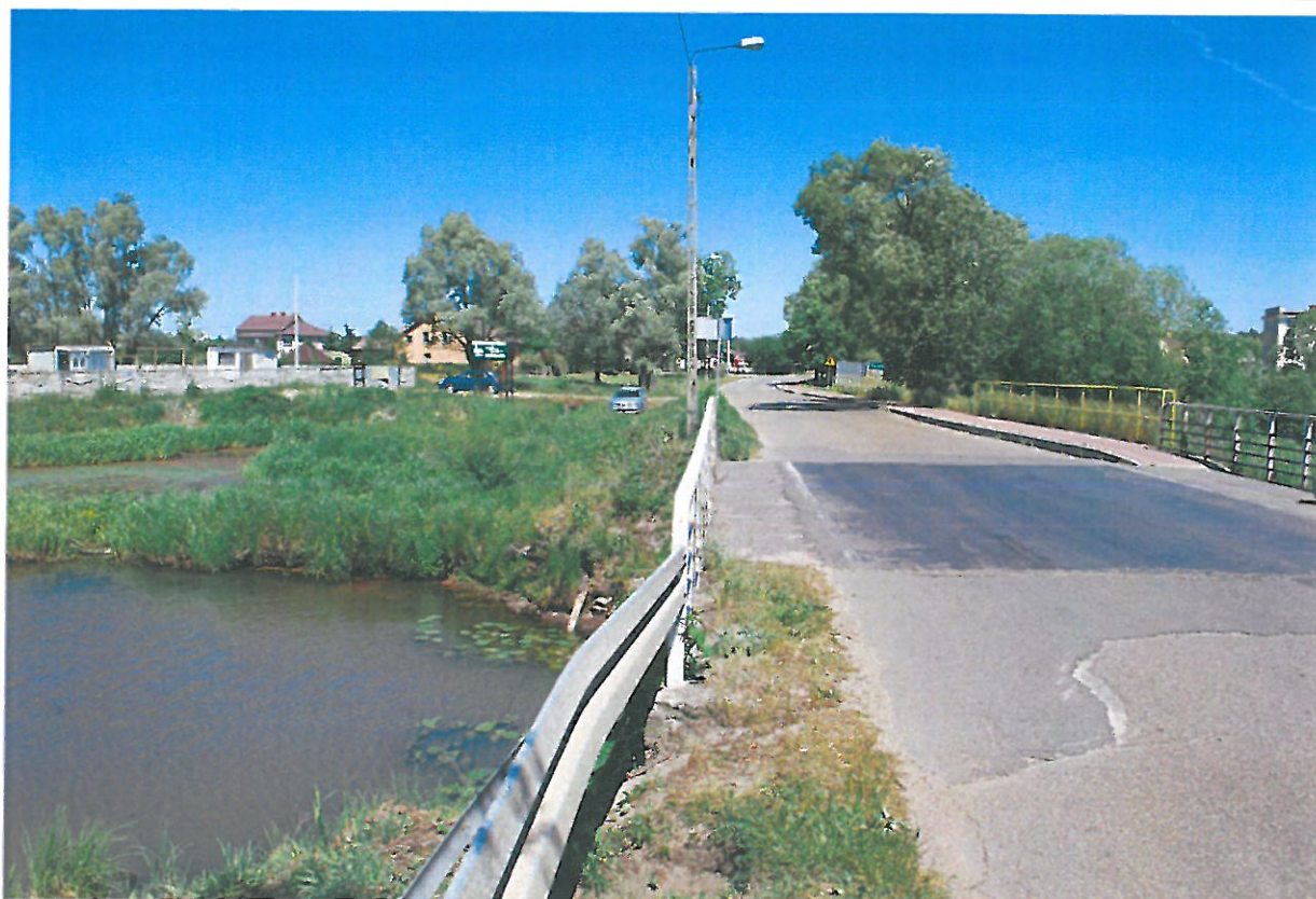
Fot. 13. Wegetacja roślin, zanieczyszczenia chodnika. Deformacja bariery drogowej.